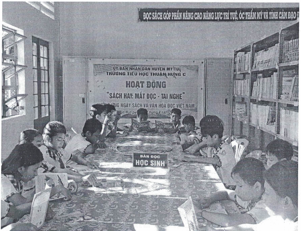
Trên đây là kết quả Tổ chức Ngày Sách và Văn hóa đọc Việt Nam được tổ chức tại đơn vị trường tiểu học Thuận Hưng C.